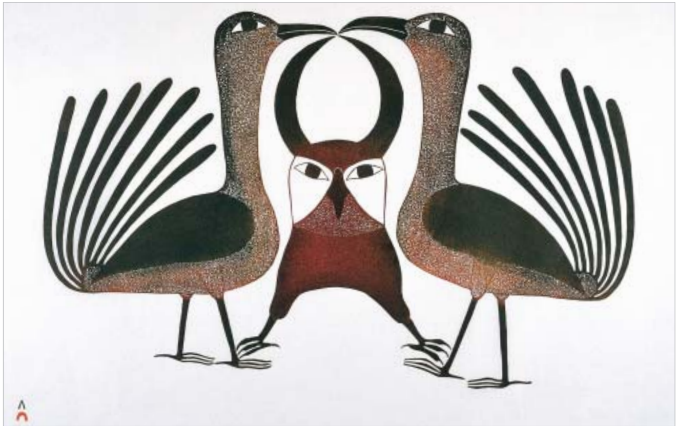
የዳዊት ገጽ 104 ላይ "Birds"