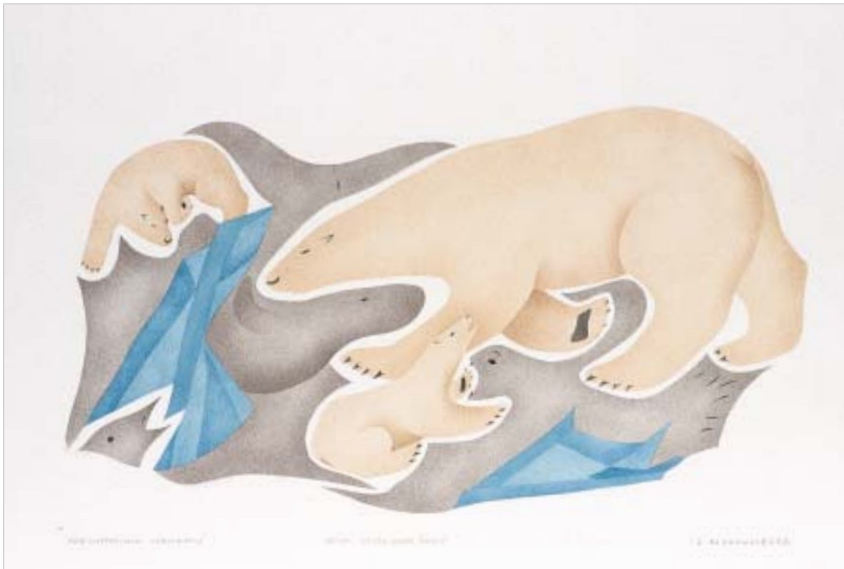
ᐃᑖᑦᑦ ᑖᐃᑦᐃᐅ ᑭᑦᑕᑦᐃᑦᐃᑦ, "Nikighaminik Naimayon"