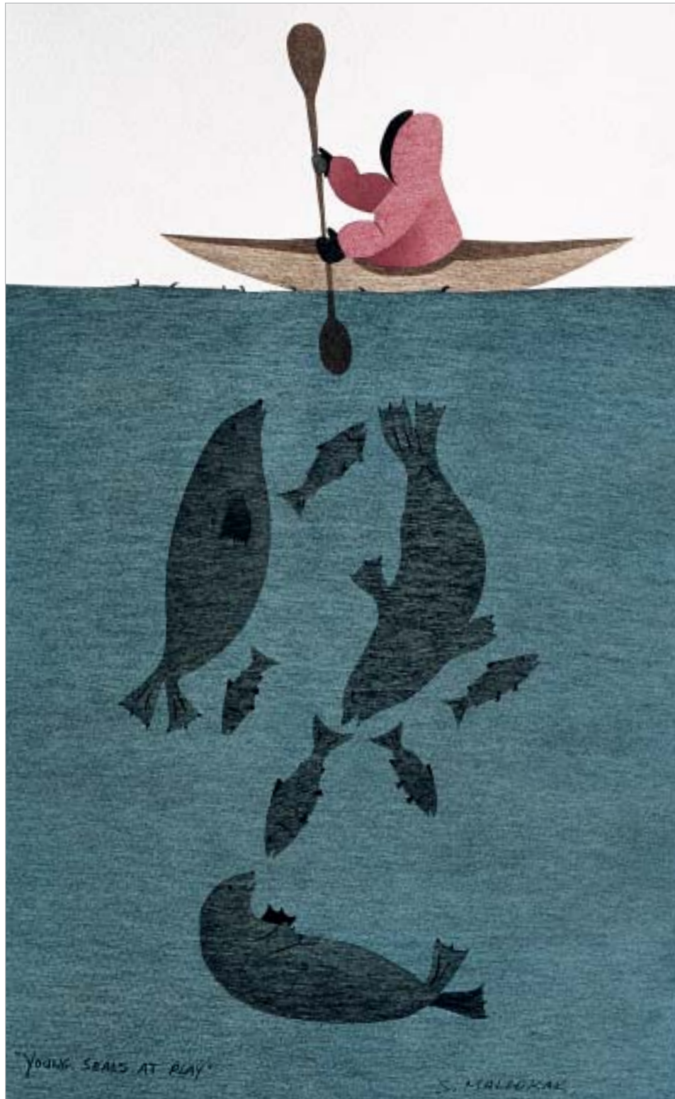
ሥ ሊጋጌጌጌ, "Young Seals at Play"