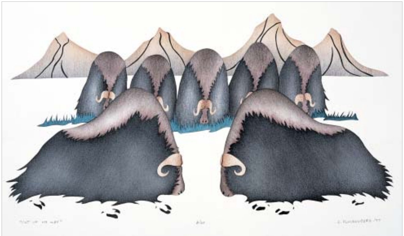
ᐃᐅᐅᐅ ᐅᐅᐅᐅ ᐅᐅᐅᐅᐅᐅ, "Out of my Way"