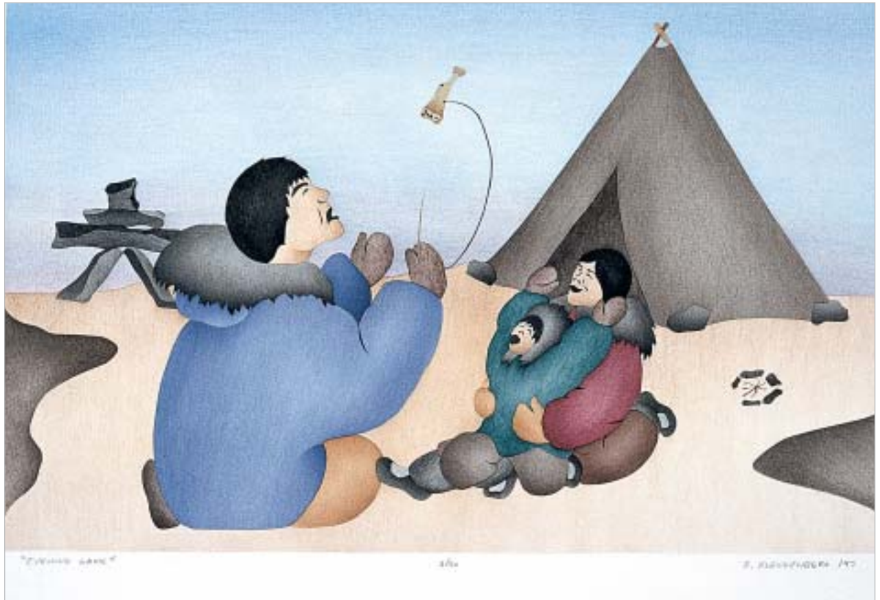
ԱՊՐ ԳԵՐԹՔ ԲԵՆԵՃՆԻ, "Evening Game"