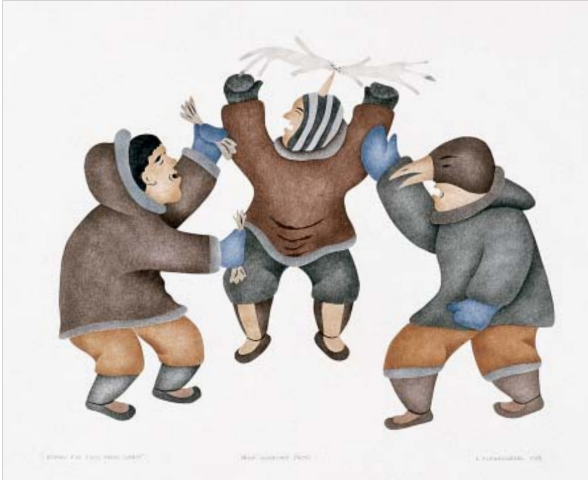
ገገናዎች ለገገናዎች ለገገናዎች, "Asking for Food from Spirits"