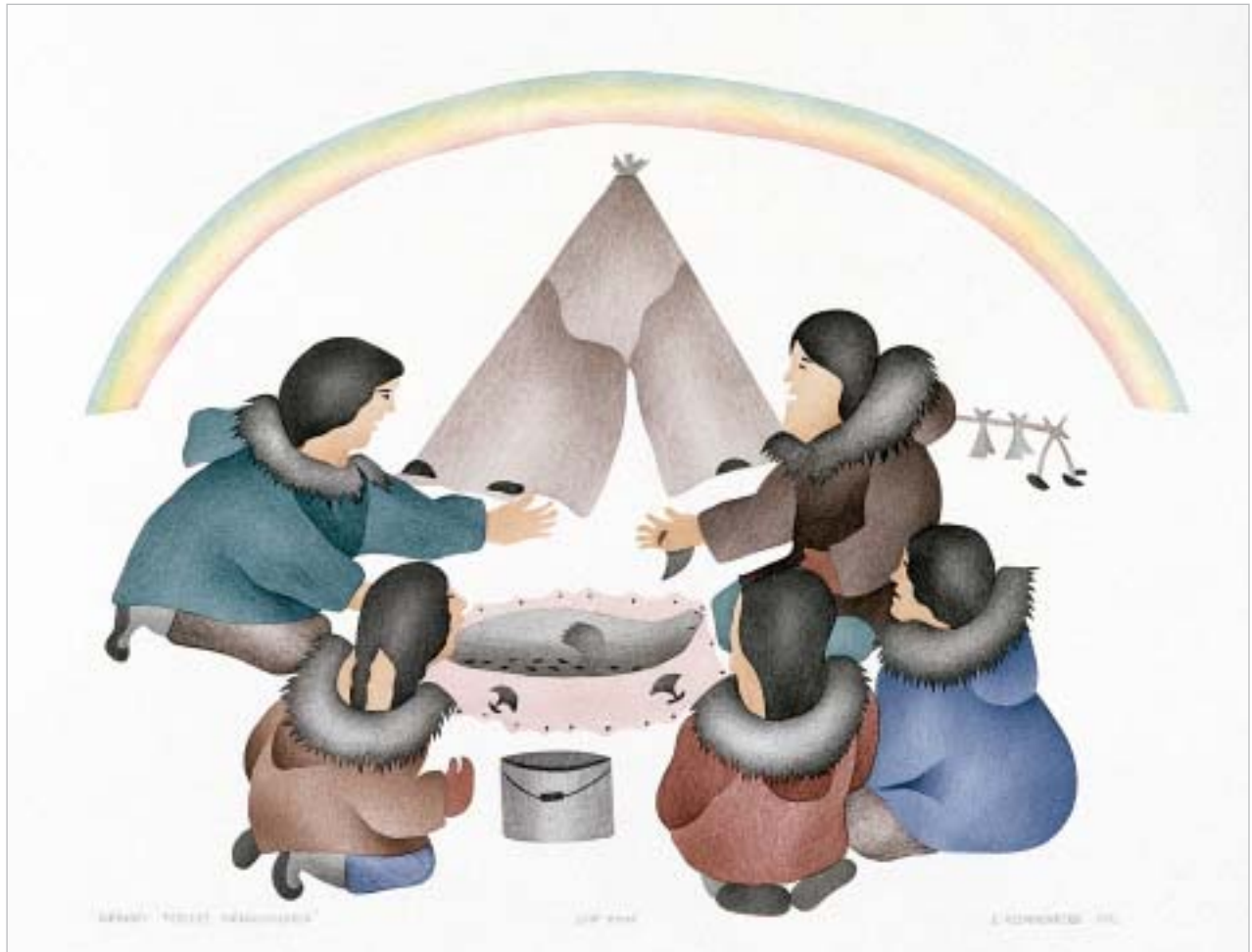
Διάγρ. Κλεοφῆ Ρεῦβένη, "Granny Teaches Grandchildren"