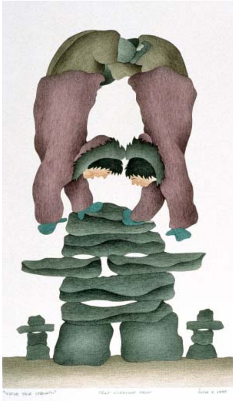
ልጅ ለገጽ ገጽ ገጽ, "Testing Their Strength"