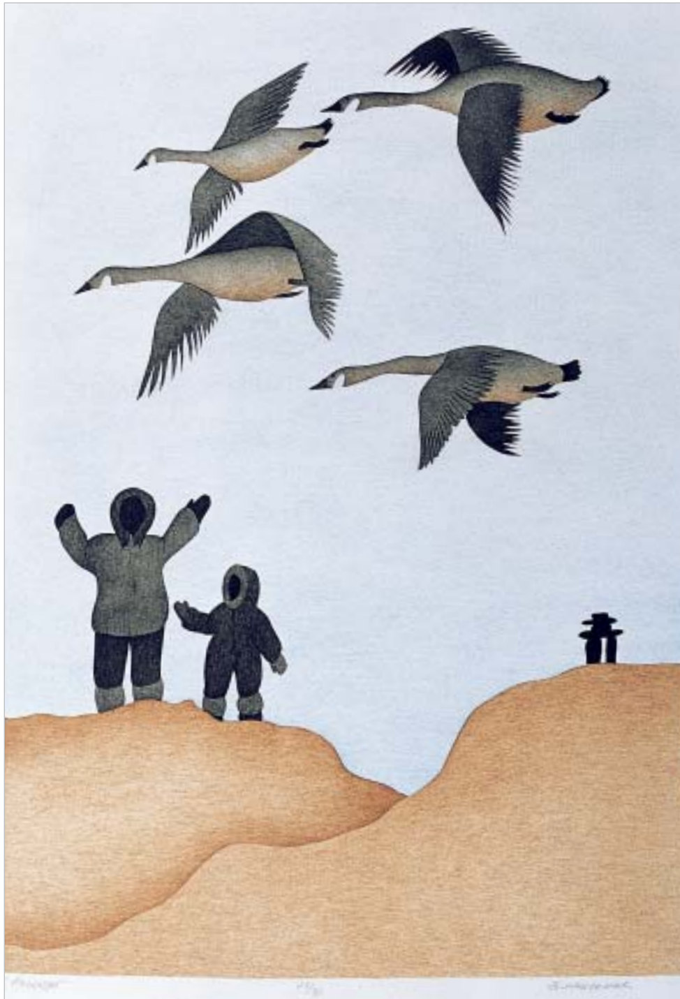
ՀԼԵԼԵ, "Good Bye"