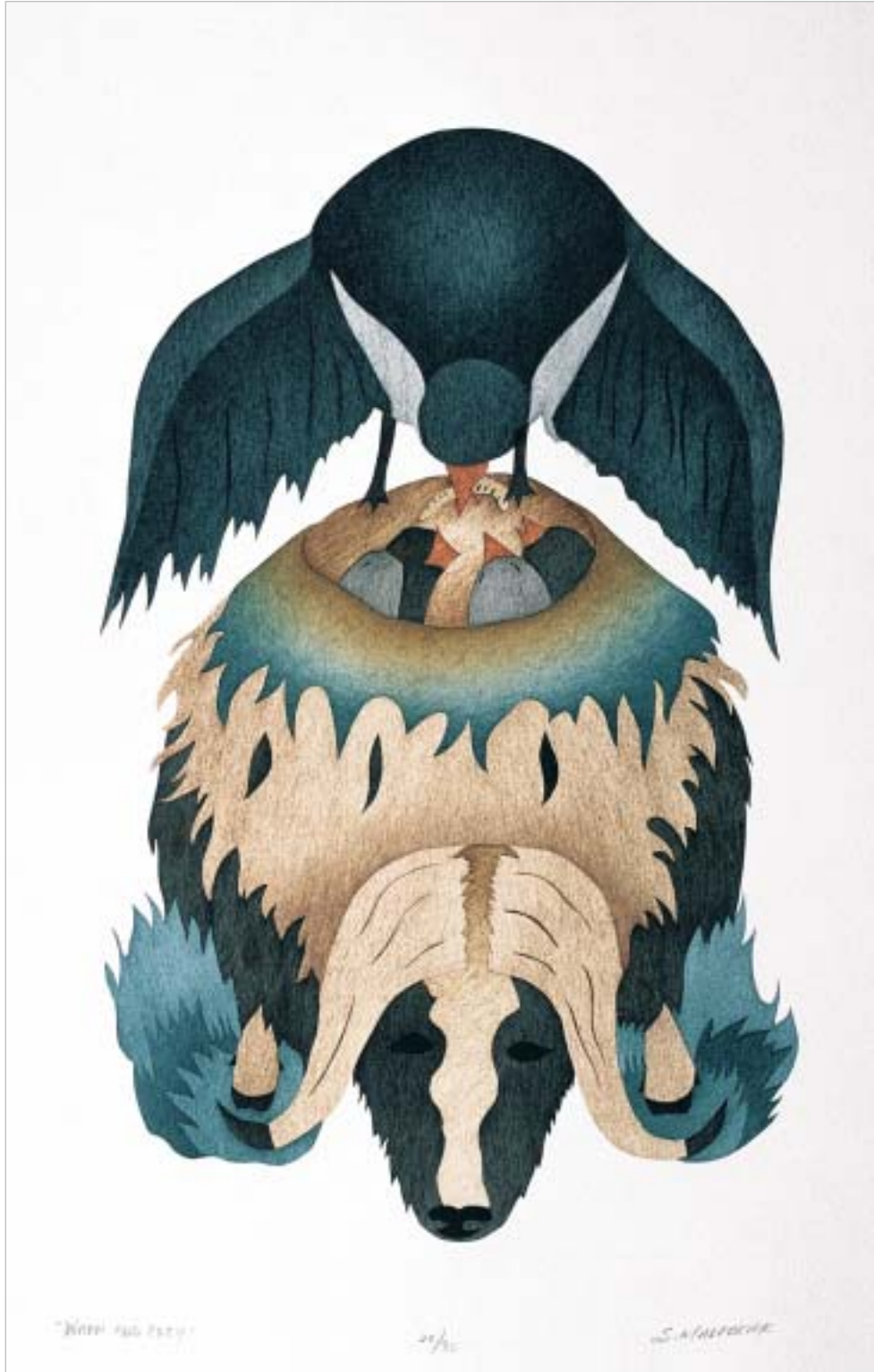
Ի ԼՆԻՅ՝ “Warm and Cozy”