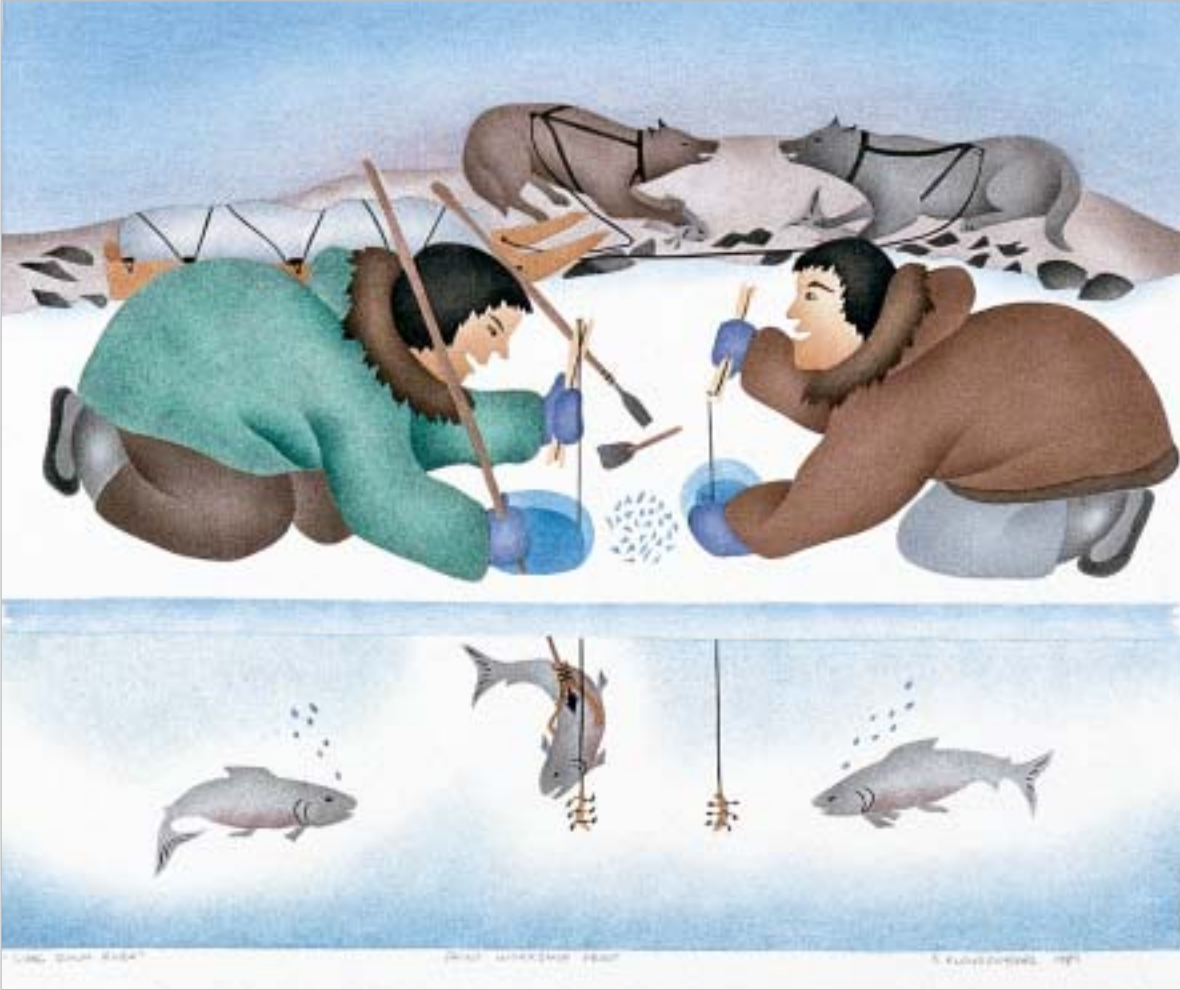
ԱՊՐ ԿԱՐՁՑ ԲԵՆՁՆՆԻ, "Going Down River"