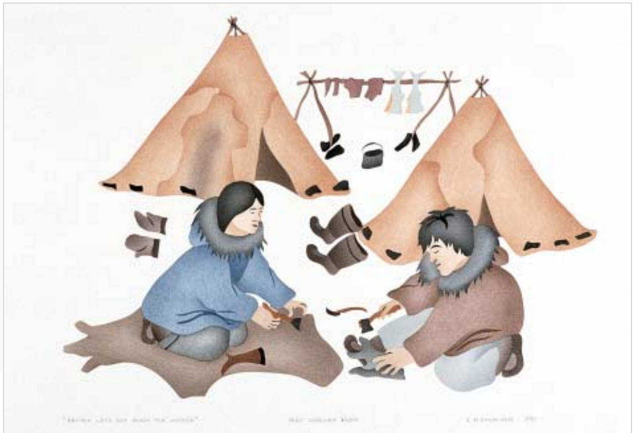
ᐃᑦᑦᑦ ᑲᐱᑦᑦ ᑭᑦᑲᑦᑲᑦᑲᑦ, "Brother Let's Get Ready for Winter"