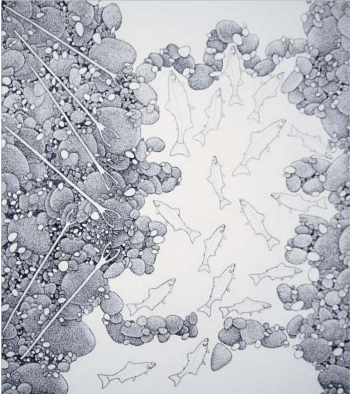
ᑭᑦᑲᑦ ᑲᑦᑲᑦᑲᑦᑲᑦ, "The Return"