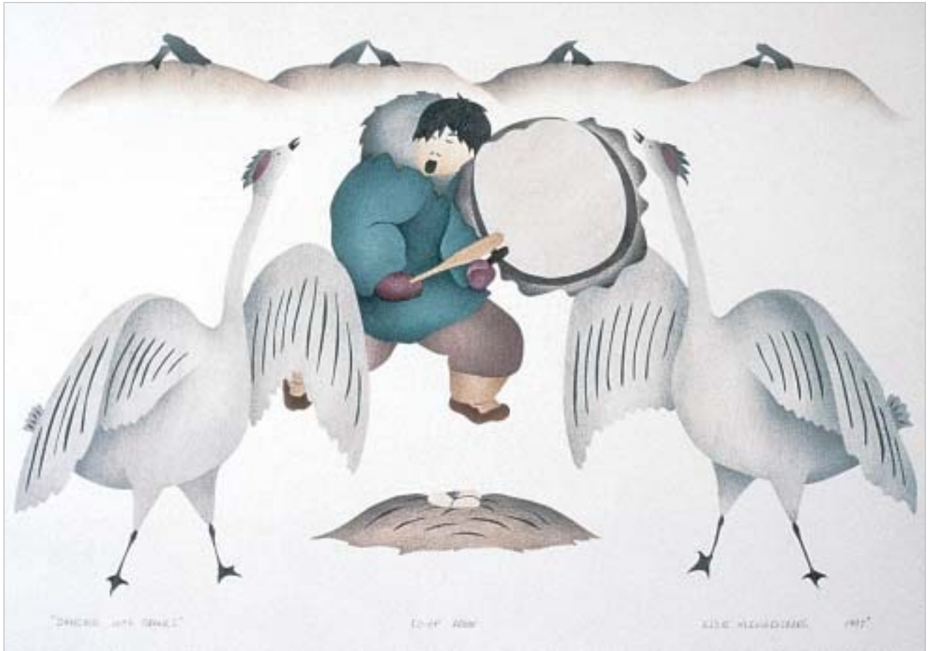
Ազոլ Վալով Քալեօն, "Dancing with Cranes"