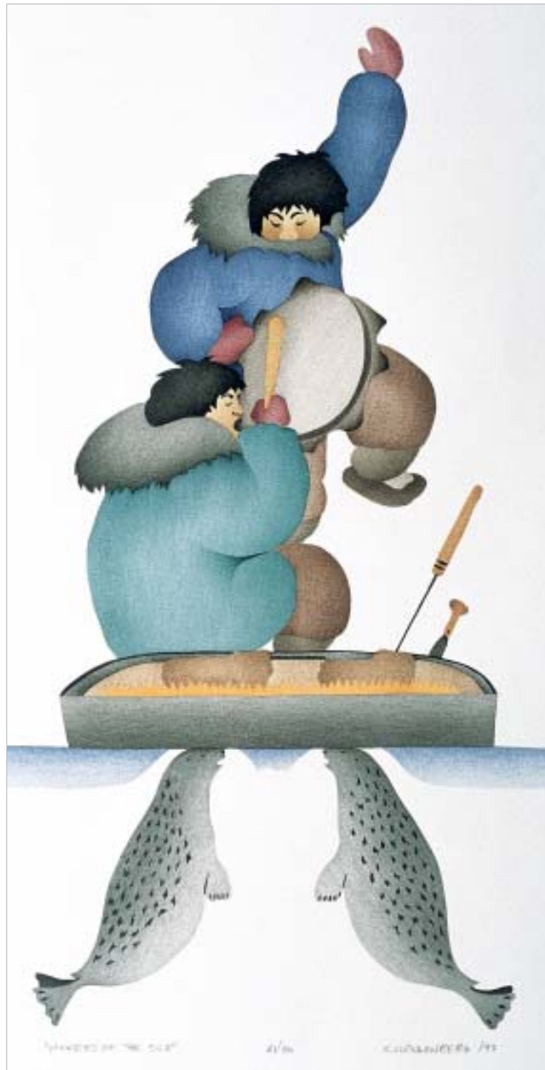
Δῶν ἄλῆαβ Ρεῖβῆῶ, "Hunters of the Sea"