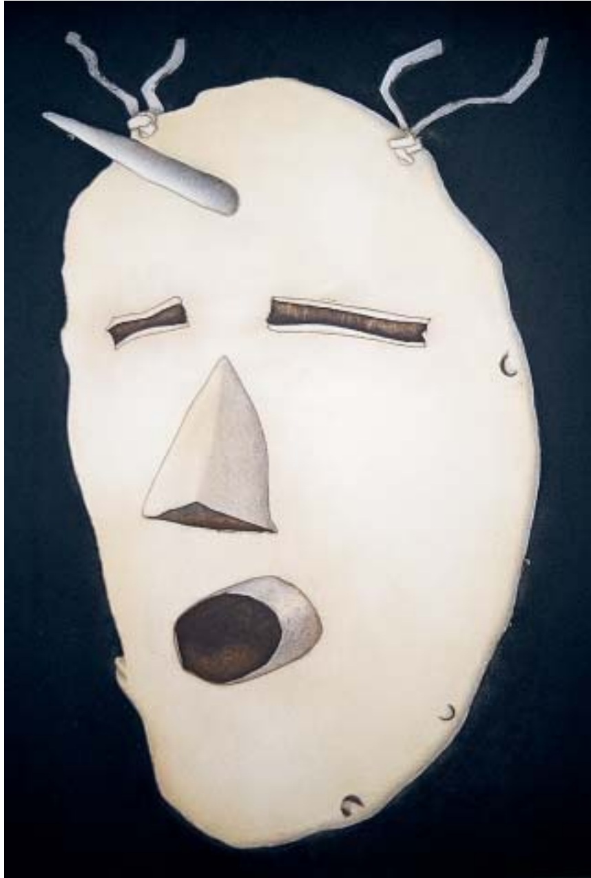
ଏମ୍‌ଏ ଶିଳ୍ପକର୍ତ୍ତାଙ୍କ "2001 Fertility Mask"