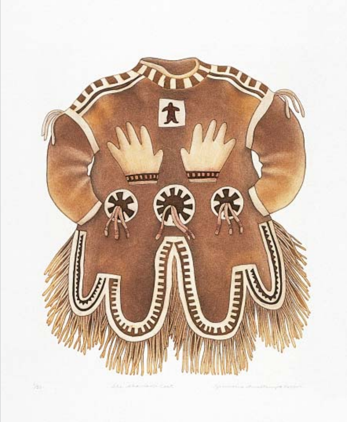
ຮູບ ຕົວເຮັດຮູບ, "Shaman's Coat"