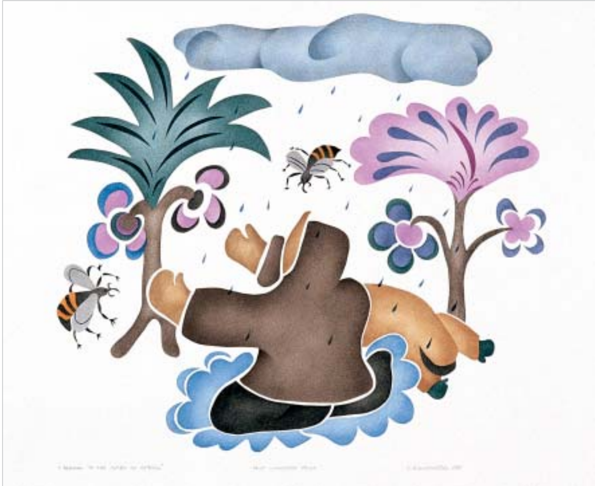
ԱՎԻ՛՛ ԿԱՐՁՅ՛՛ ՔԵՆՆ՛՛Ն՛՛, “Awakening to the Spirit of Spring”