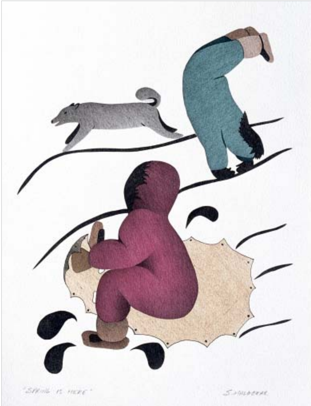
ՄԼՍԻՆԻ, "Spring is Here"